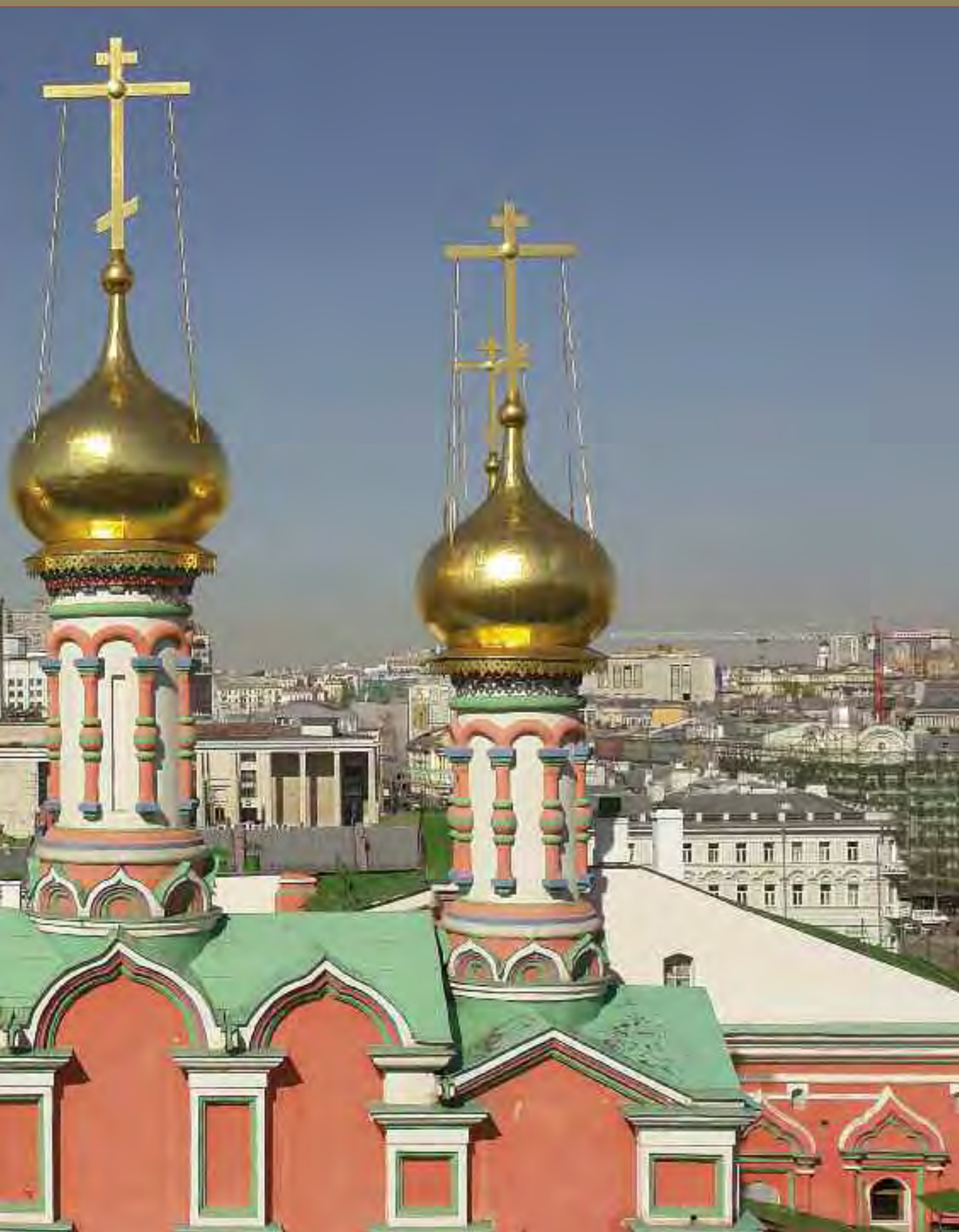
Купола церкви Похвалы Пресвятой Богородице