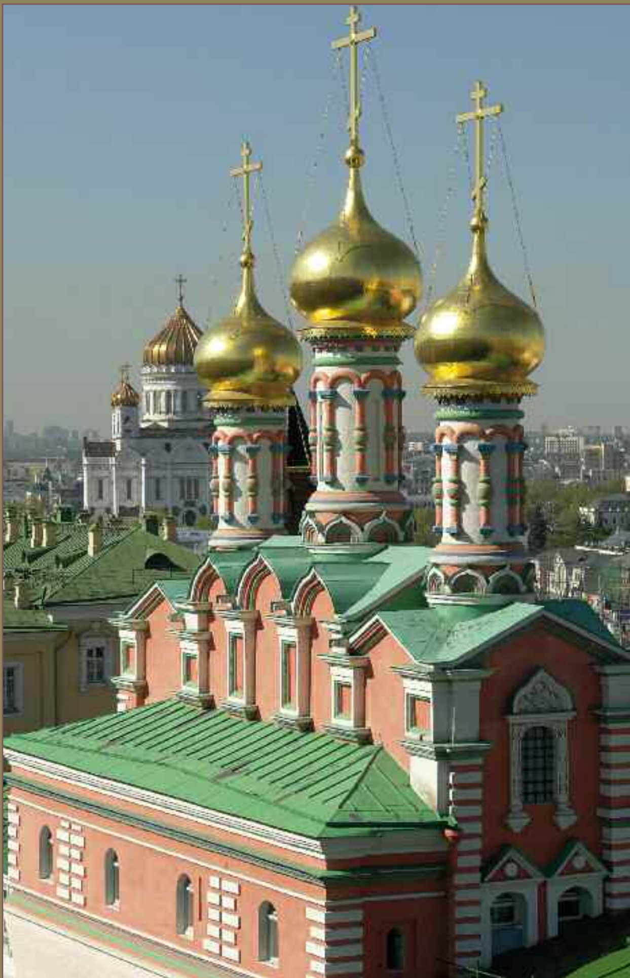
Церковь Похвалы Пресвятой Богородице