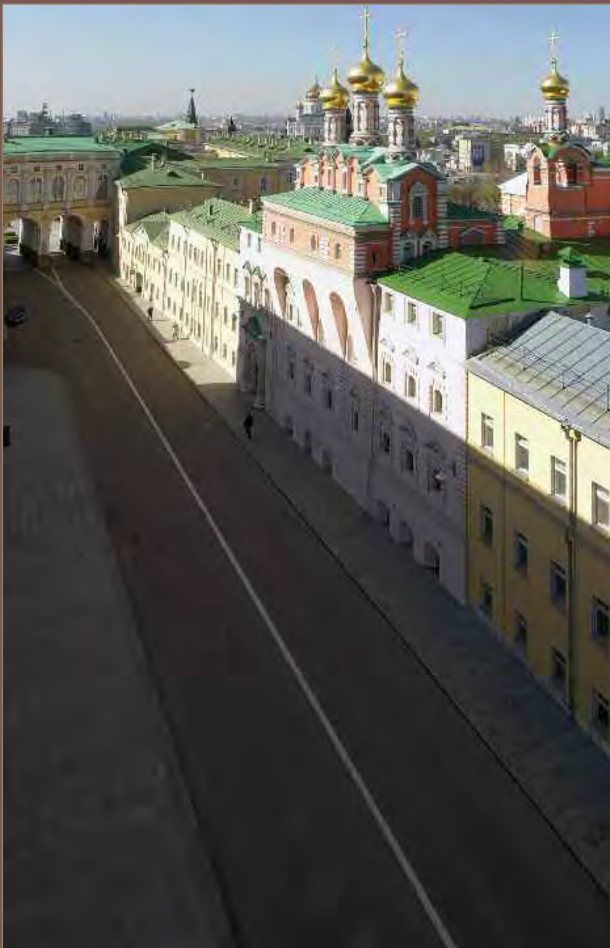
Дворцовая улица. Вид сверху