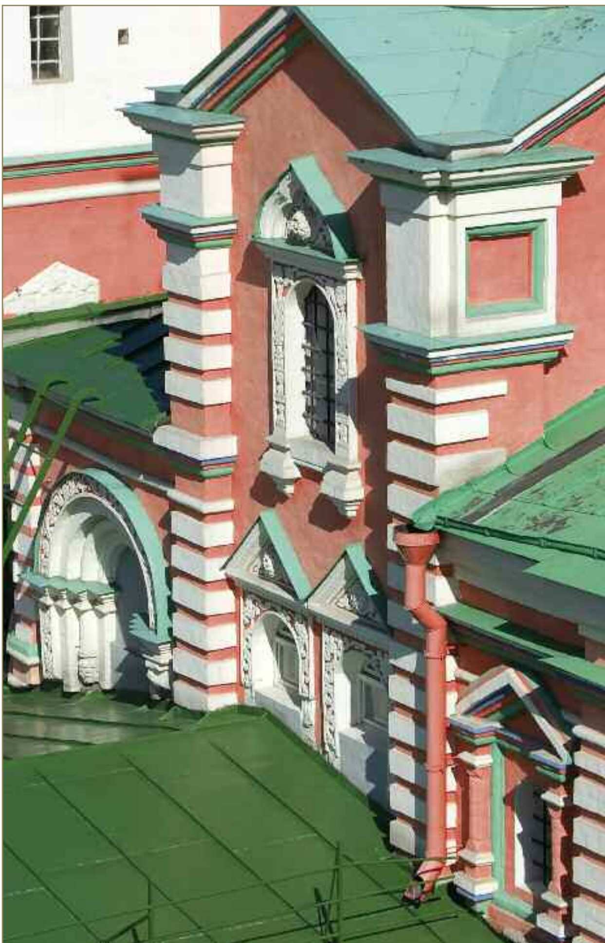
На предыдущем развороте: Церковь Похвалы Пресвятой Богородице и Потешный дворец Южный фасад Церкви Похвалы Пресвятой Богородице. Фрагмент