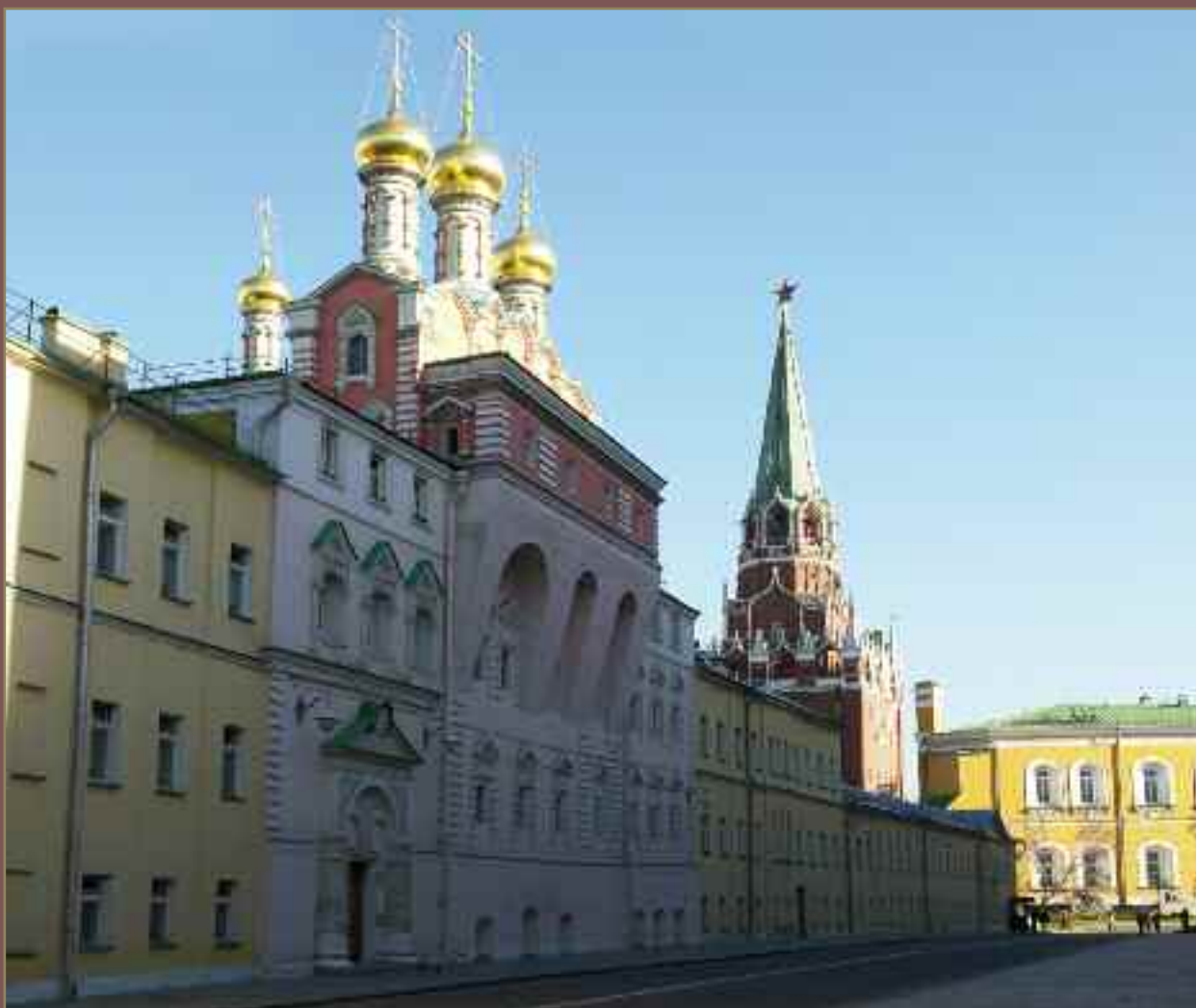
Ф.Я. Алексеев, ученики. Вид в Кремле на Потешный дворец со стороны внутреннего двора Дворцовая улица и Троицкая башня