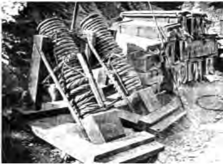
Японские станки для метания мин Уайтхеда

минную войну – путем подкопов под наши укрепления попытаться взрывать их на отдельных участках. Между тем, в сентябре погода повернула на холода. Начали иссякать запасы продовольствия. Выдача консервов была прекращена; четыре раза в неделю стали давать конину, а три дня готовить постную пищу.