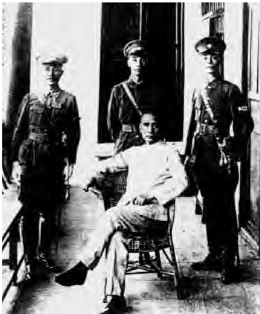
Вот так первоначально выглядела известная фотография “Сунь Ятсен и Чан Кайши в школе Вампу в 1924 году”.