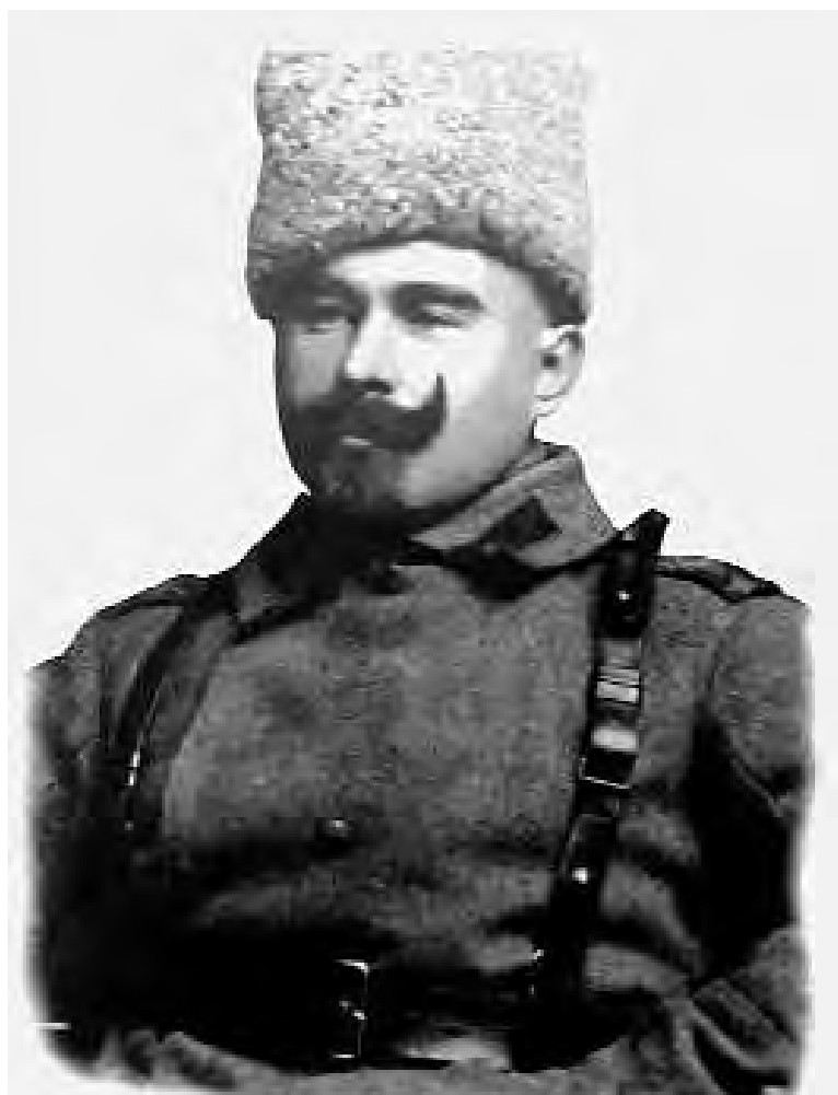
Фронтная фотография 1915 года