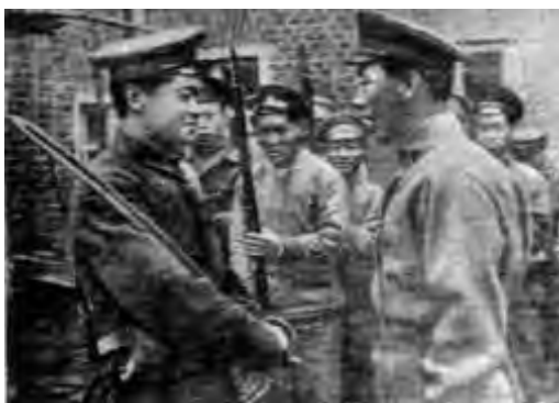
В одной из частей китайских красноармейцев-добровольцев

“Северо-Западный план” Сунь Ятсена, о котором в Москве стало известно не позднее конца 1919 года,