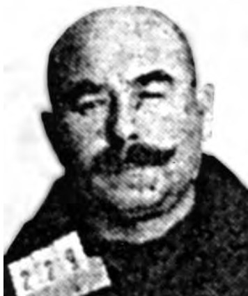
Фотография из следственного дела № 546836

В Москве имеется много дальневосточных работников (как, например, председатель Всесоюзной Торговой палаты), которые могли бы доказать всю неправдоподобность возводимых на меня обвинений. [193]