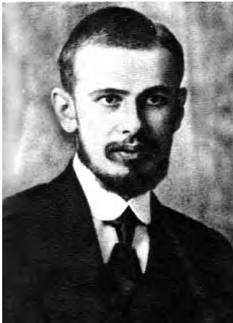
Уполномоченный Наркоминдела Е.Д. Поливанов