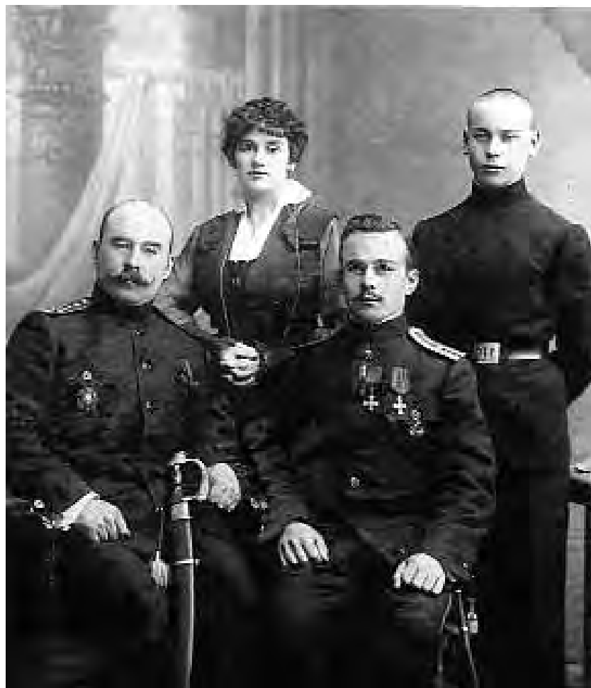
На побывке дома. 1916 год.