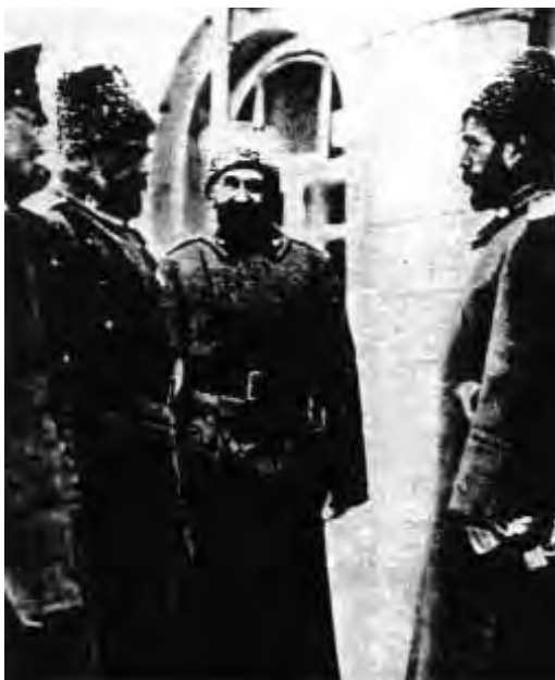
Николай II в Киеве. 1916 год.

В начале 1918-го на переговорах в Бресте Троцкий объявил о демобилизации армии. Российские вооруженные силы перестали существовать. Расформирован был и 13-й Сибирский полк. А его командир получил совершенно неожиданное для себя назначение: по приказу Троцкого он был откомандирован в Петроград. В распоряжение Народного комиссариата по иностранным делам.