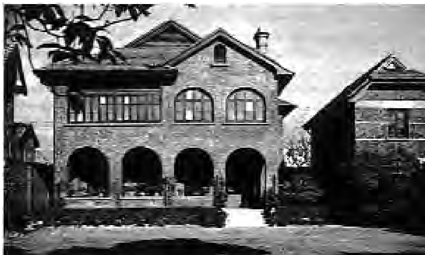
Шанхай, французская концессия, улица Мольера, 29