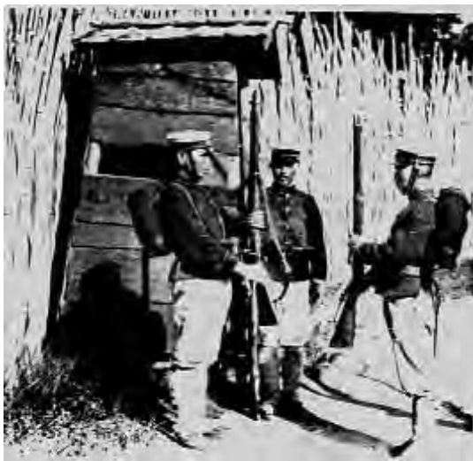
Японские часовые, охраняющие лагерь русских военнопленных

На северо-западной стороне Нагасакской бухты, среди скалистого взгорья заросла зеленая деревня Инаса, хорошо известная русскому флоту. За много лет до войны русское правительство сняло здесь в аренду участок земли, на котором были устроены шлюпочный сарай, поделочные мастерские, госпиталь. Над этими постройками господствова-