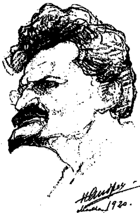
Внешность Троцкого и в самом деле была необычной

Остановившись на краю тротуара, он с тревогой глядел на дорогу, в точности, как в холодный день глядят на реку, прежде чем бросить-