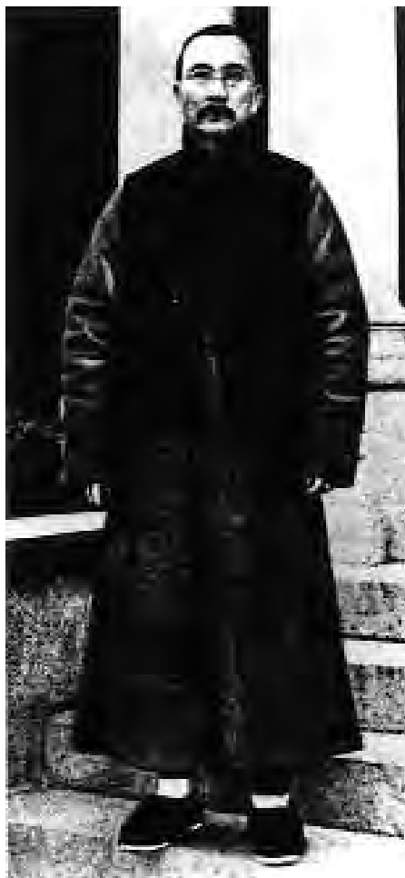
Тан Шаои – первый премьер-министр Китайской Республики

Сообщения об этом просочились в прессу, но официально оно утратило силу лишь 14 июля следующего года, спустя пять месяцев после возвращения Попова во Владивосток. Поэтому ему и было поручено получить от представителей Юга подлинный