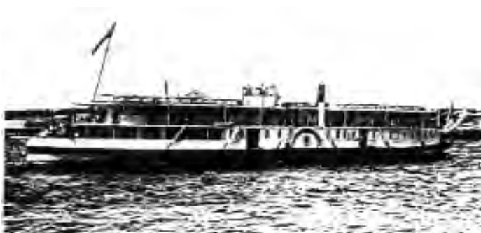
Тот самый волжский пароход